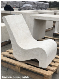
Finition blanc sable